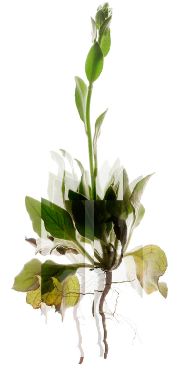
Verbascum thapsus L