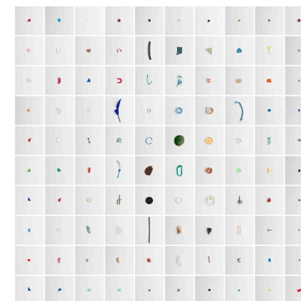
Basura Menorca Playa Cavalleria 2025