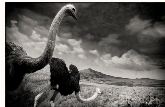
American Museum of Natural History_AMNH

- Castelo Sardina, L (2024) Flujos de trabajo en la documentación de los modelos anatómicos del Museo Veterinario Complutense . (Cap.) Pp.